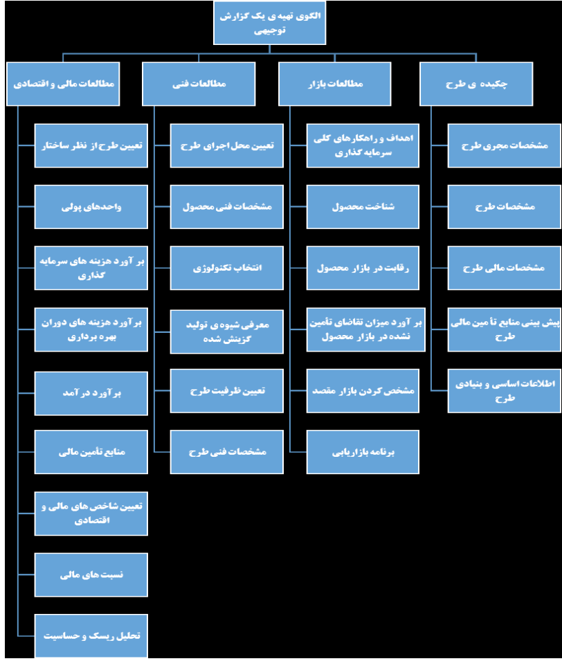
تصویر ۱-۲. نگاهی کلی به چگونگی تهیه گزارش توجیهی.